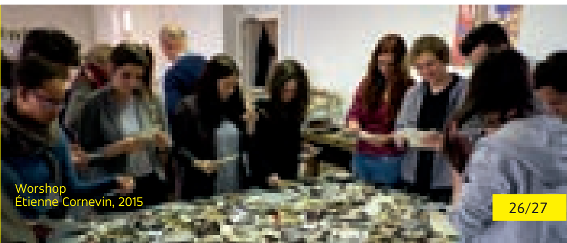
Worshop Étienne Cornevin, 2015