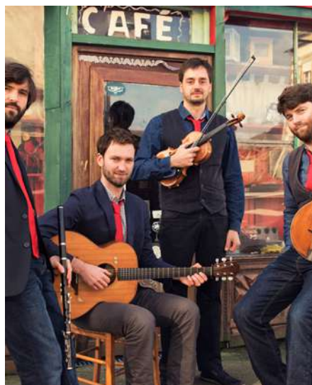
Poppy Seeds © Eric Legret.

Après une année anniversaire rythmée par de nombreuses surprises, la scène nationale Équinoxe de Châteauroux lance sa nouvelle saison 2025-2026 avec trois rendez-vous à ne pas manquer.