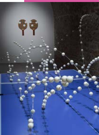
© Richard Fauguet - collection Frac Arthothèque Nouvelle-Aquitaine, Limoges (France)

Un beau départ pour cet artiste qui ne cessera d'entretenir des liens d'amitié et professionnels avec ce lieu. Aujourd'hui reconnu dans le milieu de l'art contemporain et présent dans de nombreuses collections, il est représenté à Paris par la galerie Art concept. À l'Ebacm, où il expose jusqu'au 14 septembre, Richard Fauguet présente une œuvre emblématique de sa démarche, produite en 2000 pour La beauté du geste au Centre d'art de Vassivière : une sculpture/image représentant une partie de ping-pong. L'exposition conçue comme un ensemble à jouer met en lien cette pièce avec une autre sculpture pour créer un duo « table rebond » et « table trouée », qui fait appel à la participation du public puisque des raquettes sont mises à sa disposition.